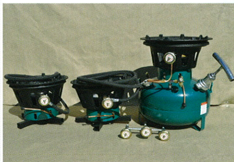
※SI-55本体と五徳セット2セット、 3口バルブの組合せ例